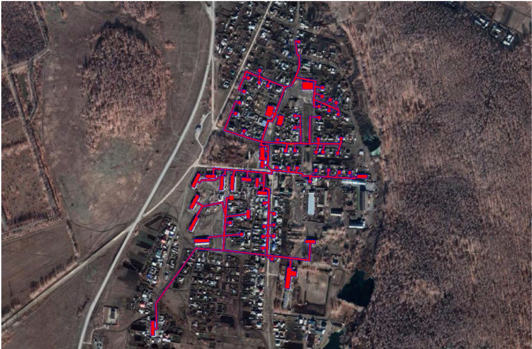
Рисунок 1.1 – Существующие зоны действия источников теплоснабжения на территории села Ларино